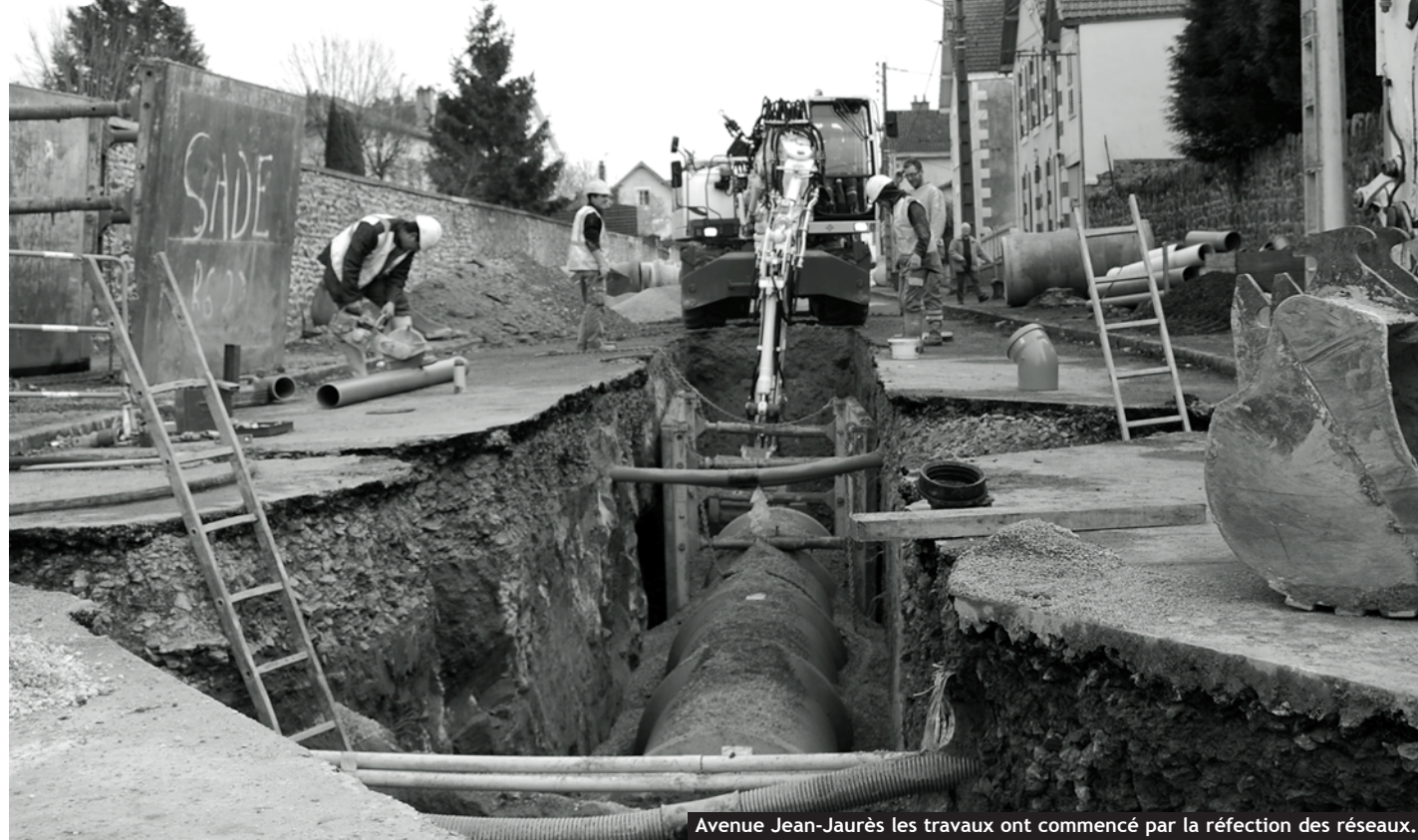
Avenue Jean-Jaurès les travaux ont commencé par la réfection des réseaux.