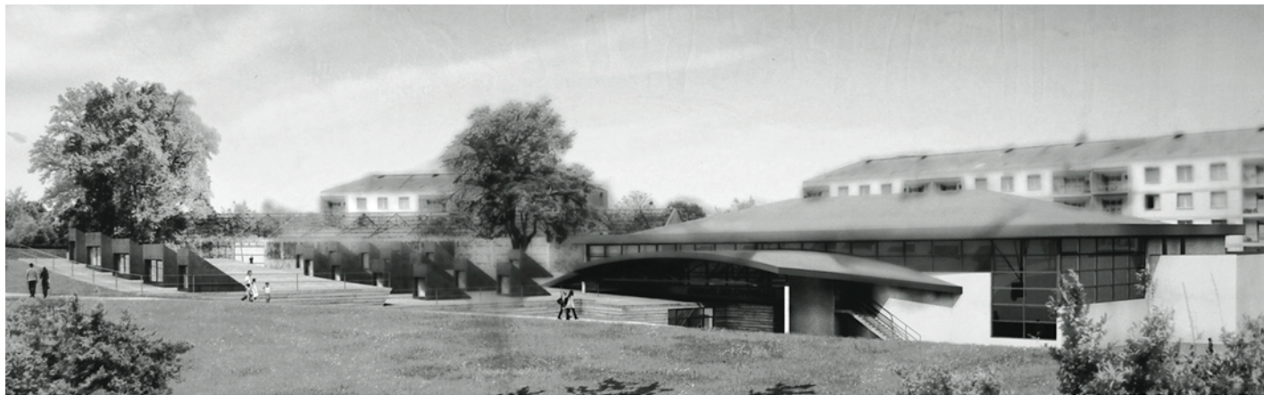
Esquisse et plan de coupe du projet de salles sportives aux Charmilles