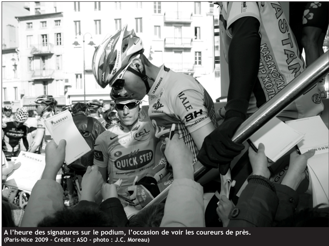
A l'heure des signatures sur le podium, l'occasion de voir les coureurs de près. (Paris-Nice 2009)

Arrivés la veille à Limoges, les coureurs s'élanceront pour un périple de 208 km qui les conduira à Aurillac. Dès 10h00, le public pourra voir les coureurs au moment des signatures, sur le podium installé au bas du Champ