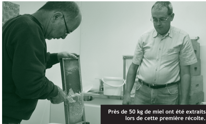
Près de 50 kg de miel ont été extraits lors de cette première récolte.