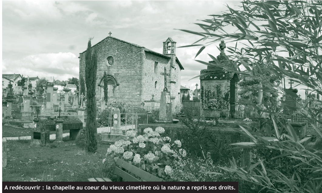
A redécouvrir : la chapelle au coeur du vieux cimetière où la nature a repris ses droits.

Les 31 e Journées du patrimoine, qui se dérouleront les 20 et 21 septembre sont placées sous le signe de la nature. Le patrimoine culturel est associé à son environnement naturel. Un thème particulièrement pertinent pour Saint-Junien où histoire, art et nature se côtoient en différents lieux symboliques de la ville. C'est donc par une approche environnementale que se dérouleront les visites du site Corot, des terrasses de Saint-Amand, de la Collégiale, de la Chapelle Notre-dame-du-pont et de la chapelle du cimetière. Ce sera l'occasion de découvrir les récentes restaurations effectuées sur les monuments : façades, retables... ou encore le réaménagement paysager du vieux cimetière, mais aussi de s'approprier leur environnement naturel. Des ânes pourront accompagner la visite du site Corot, et des ateliers Mandalas land'art participatifs se-