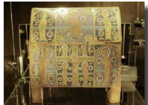
Châsse en émail champlevé du 13 e siècle