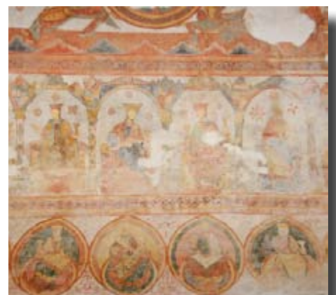
Détail de la fresque de la voûte