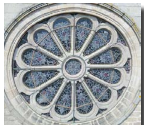
Rosace du transept Sud